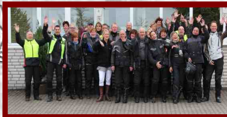
Weekend weg motoren