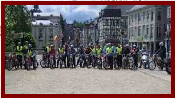
Weekend weg brommers