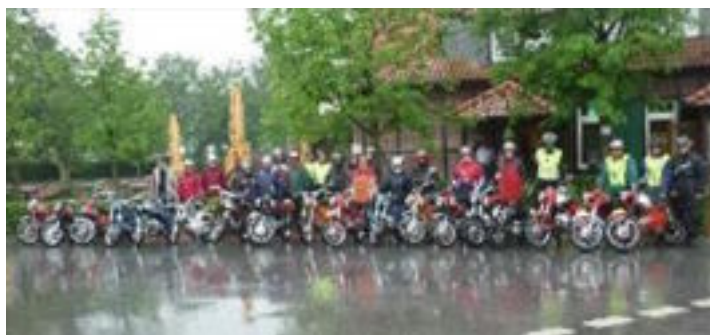
Weekend weg brommers