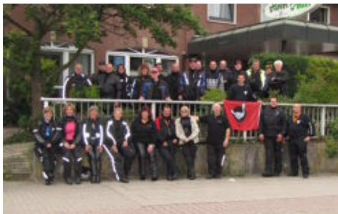
Weekend weg motoren